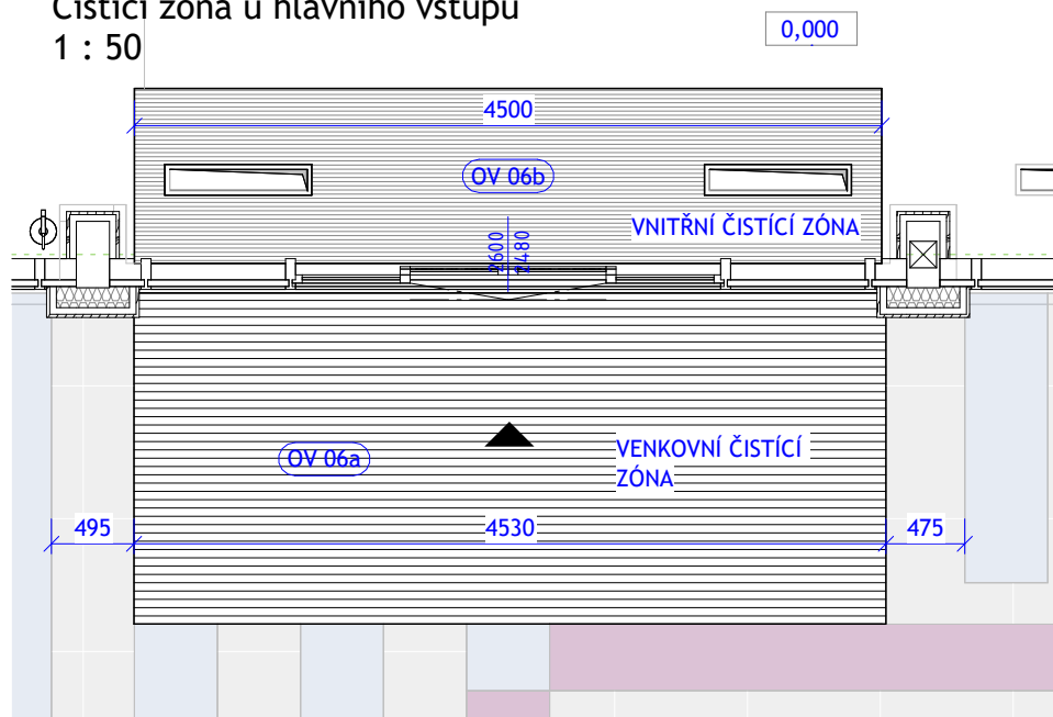
Čistící zóna u hlavního vstupu 1 : 50